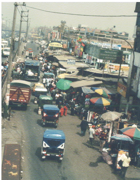
Figura4: El comercio formal e informal (ambulantes) a 200 metros del centro del distrito de Ate, En los últimos años el comercio informal ha crecido y logra ubicarse al costado del formalmente constituido congestionando el tránsito.