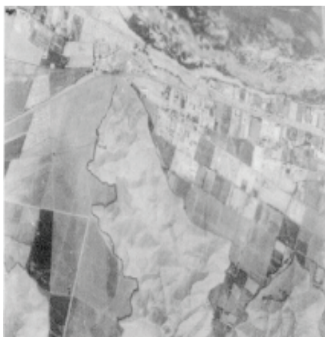
Figura 5: Estas dos fotografías aéreas de 1961 muestra el poblado de Vitarte y sus espacios agrícolas.