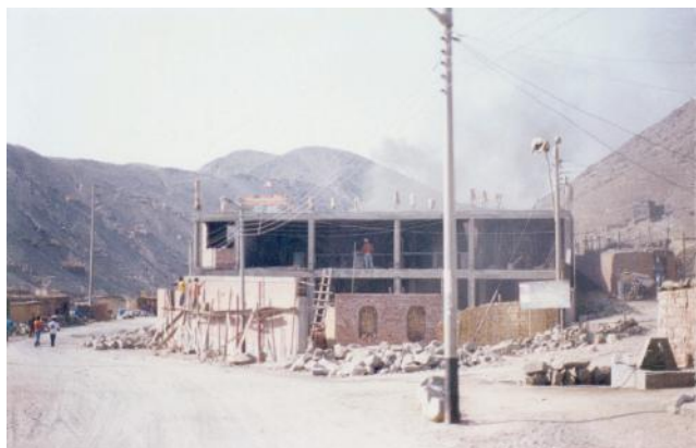
Figura 7: En esta fotografía podemos observar el mismo Local Comunal después de años (2005) y claramente se observa el crecimiento poblacional mayor número de invasores y el servicio de transporte público aumenta, así como la presión por servicios básicos.