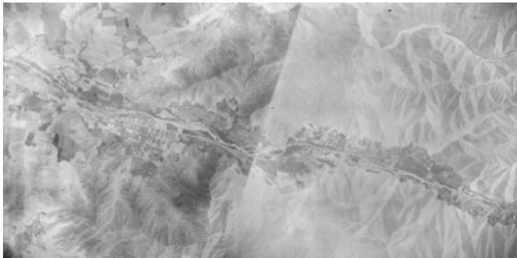
Figura 1: Fotografía aérea del distrito de Ate 1961, que abarca hoy las 6 zonas del distrito la zona Ate-Mayorazgo y Vitarte Central; la zona de Santa Clara y lo que hoy es Huaycan y Horacio Zeballos, todas ellas eran extensas áreas agrícolas.