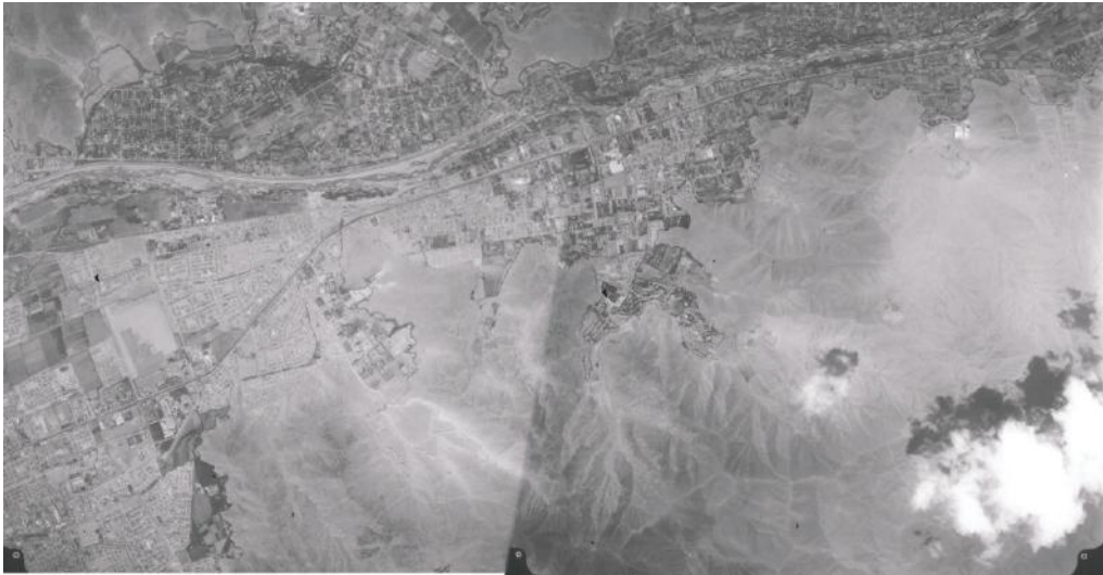
Figura 3: Procesos informales de urbanización y suelo agrícola urbanizado