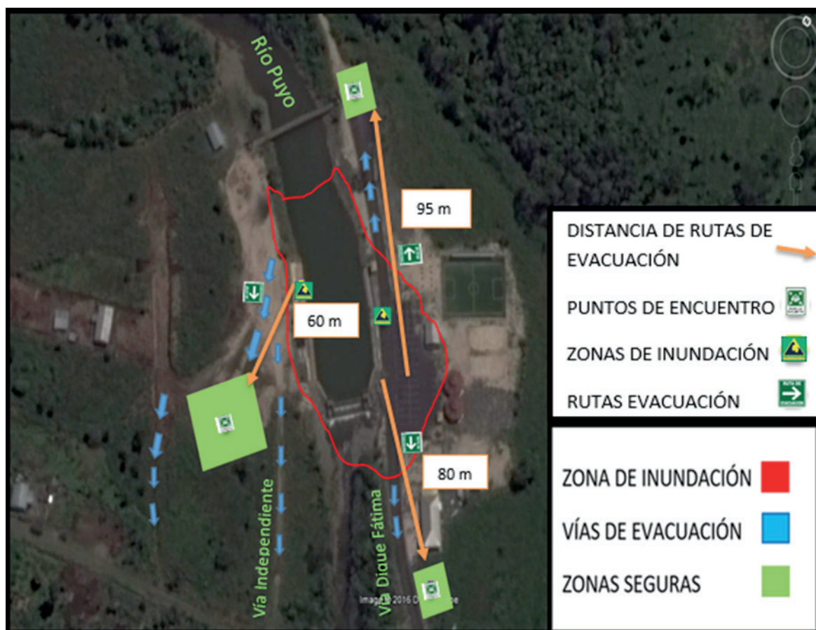
Figura 2. Sistema de señales por colores para la zona de inundación del dique de Fátima.

En esta figura se presenta la planicie del dique de Fátima, ubicada en la parroquia del mismo nombre, con coordenadas de latitud ( -1^{\circ} 26' 45'' E) y longitud ( -72^{\circ} 0' 23'' S), en cuanto a señalética en este sector se plantea colocar tres letreros de vías de evacuación (zona azul del gráfico), dos letreros de zona de inundación a 20 m del dique (uno a cada costado del dique) y tres letreros de zonas seguras (zona verde de la figura).